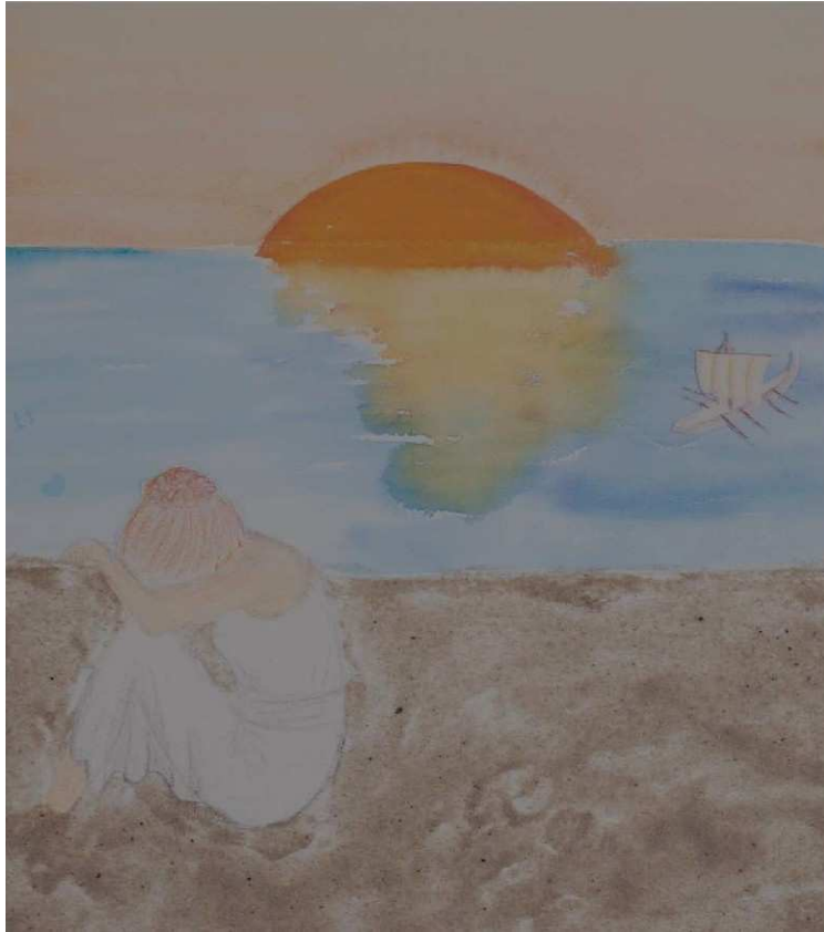
Monteverdi: Lamento d' Arianna

Arianna wordt verlaten door haar geliefde Theseus